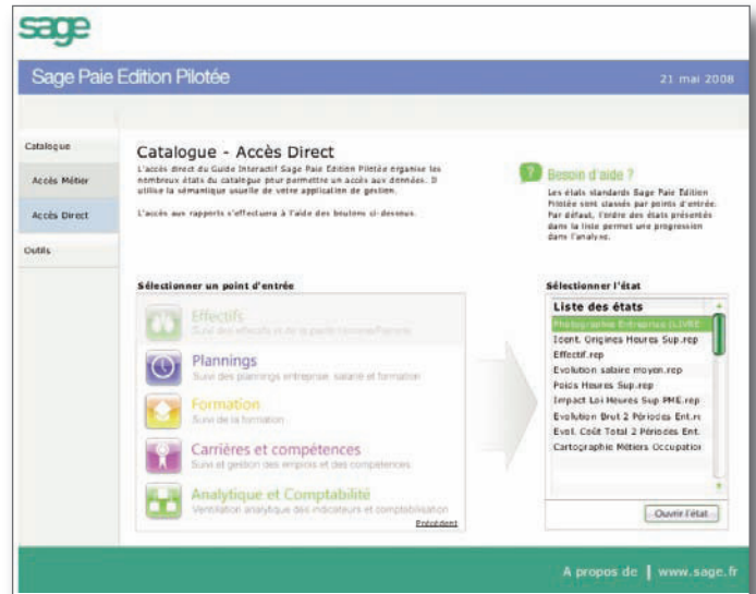
Page d'accueil pour le responsable RH

Grâce au guide interactif, vous pouvez :