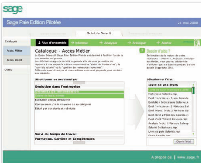
Analyse de l'évolution de votre entreprise